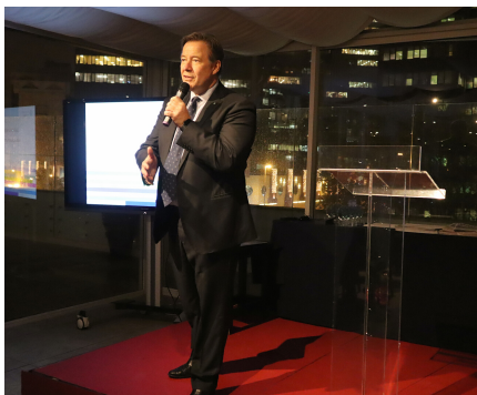
CHART AWARD DINNER