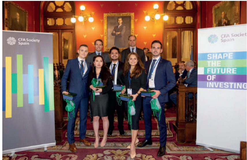
EADA Business School, ganadores de la etapa local española del CFA Institute Research Challenge.

demostrado una capacidad y dominio de habilidades de análisis financiero excepcionales.