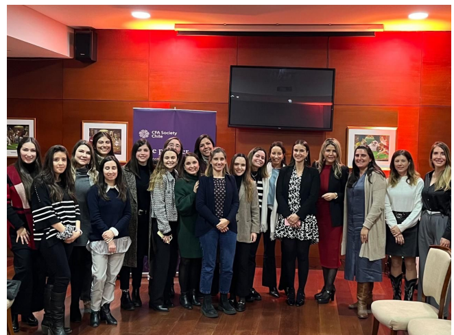
Imagen 1: Eventos de Networking CFA Society Chile y Mujeres Empresarias

En esa instancia logramos juntarnos y ahondar en diversas motivaciones para la creación de redes. Members con más de 10 años de experiencia, señalaban la necesidad de seguir expandiendo contactos y planear el siguiente ciclo de nuestras carreras laborales. Mientras que para las candidates y miembros más jóvenes de la Society fue de vital importancia mirar al futuro delineando su plan de carrera y apoyarse en las experiencias de otras mujeres en la superación de obstáculos diarios.