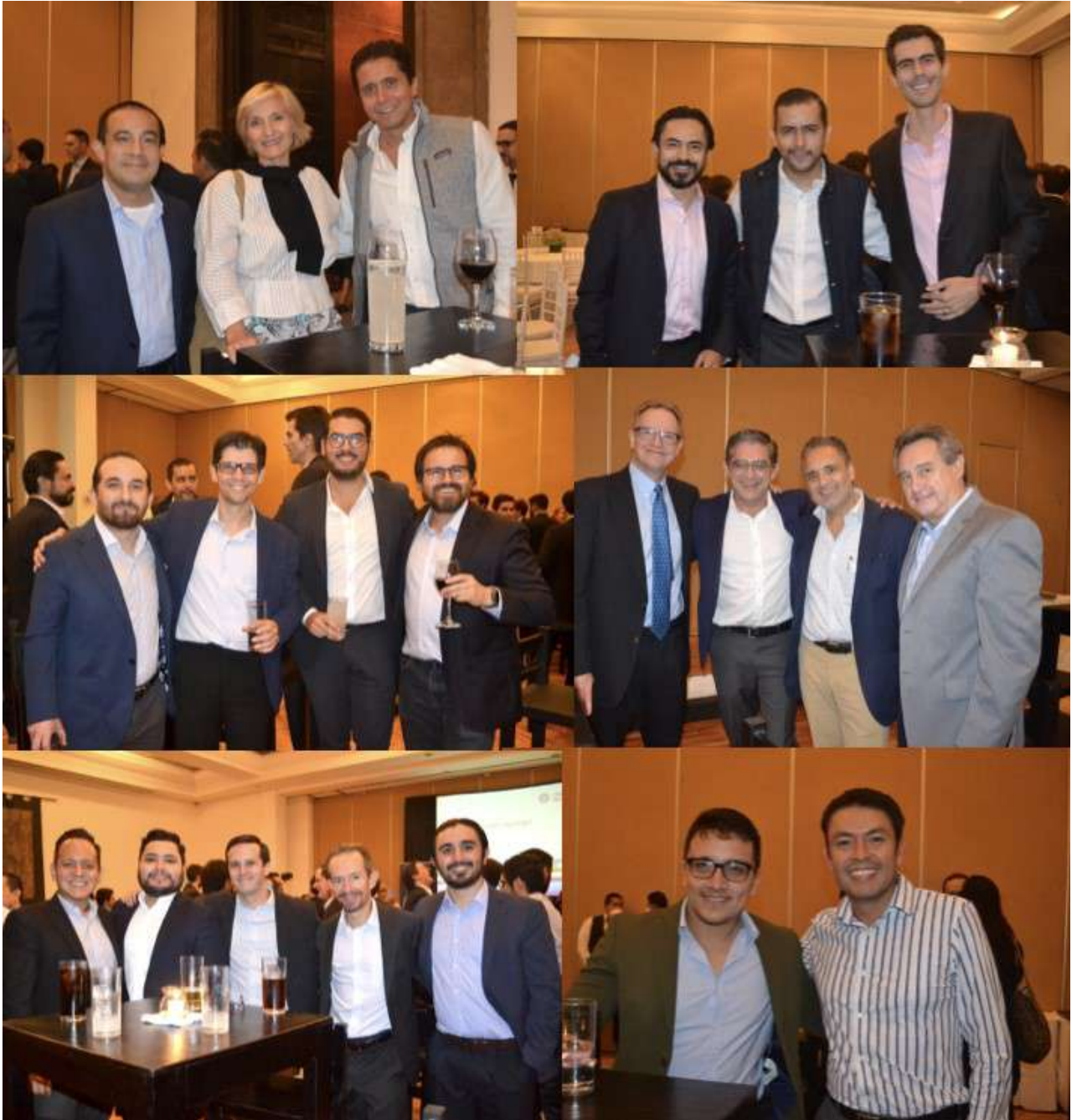
Miembros CFA charterholders que nos acompañaron