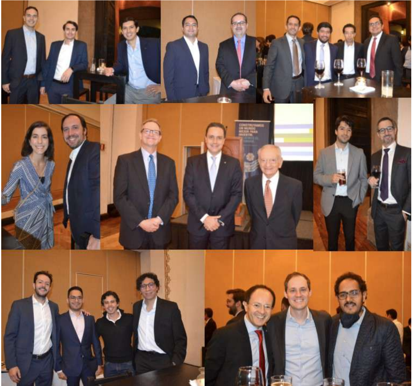
Miembros CFA charterholders que nos acompañaron