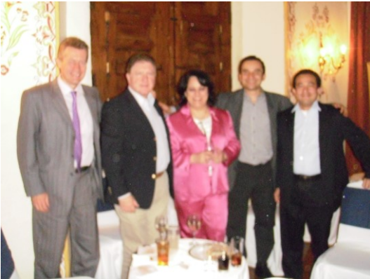
CFA Day 2012