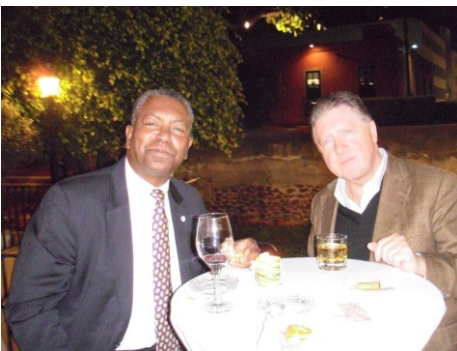
Entrega charter 2012