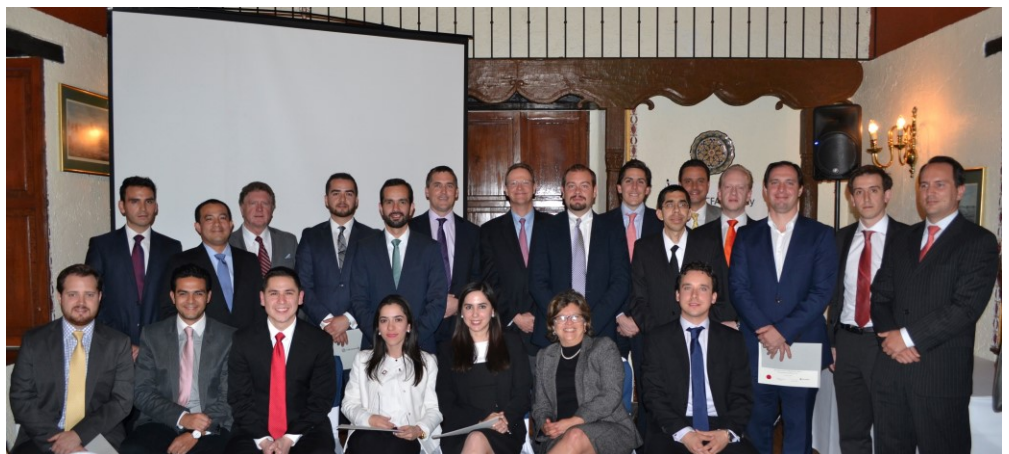
Entrega charter 2015