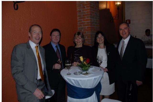
Entrega charter 2011