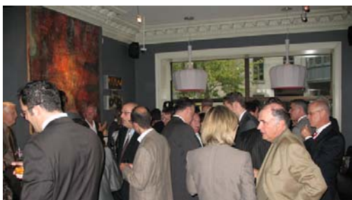
Une belle brochette de représentants des différents secteurs de la communauté d'assurance de Montréal.

L'événement avait lieu au Phillips Lounge, endroit tout à fait désigné pour ce type de rassemblement. Il faut dire que l'Association est passée maître dans l'art de nous dénicher des lieux intéressants et différents pour la tenue de ses cocktails. Tous les ingrédients pour faire de cet événement une réussite y étaient réunis : une bonne présence des membres et amis de l'Association, de bonnes bouchées, du bon vin, sans oublier de la bonne eau et surtout de la bonne humeur !