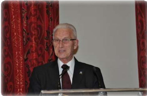
Gérard Dutil

Quelques neuf mois plus tard les souvenirs sont encore bien ancrés dans la mémoire de celui qui avait la lourde tâche de réassurer ses citoyens et les aider dans la mesure du possible.