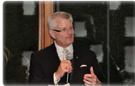
Président de RIMS - Photo : Stéphane Cossette

Le président de RIMS à New York était de passage à Montréal pour l'occasion et il en a profité pour nous faire part des projets en cours à la maison mère de notre association et nous offrir ses vœux pour la saison des Fêtes.